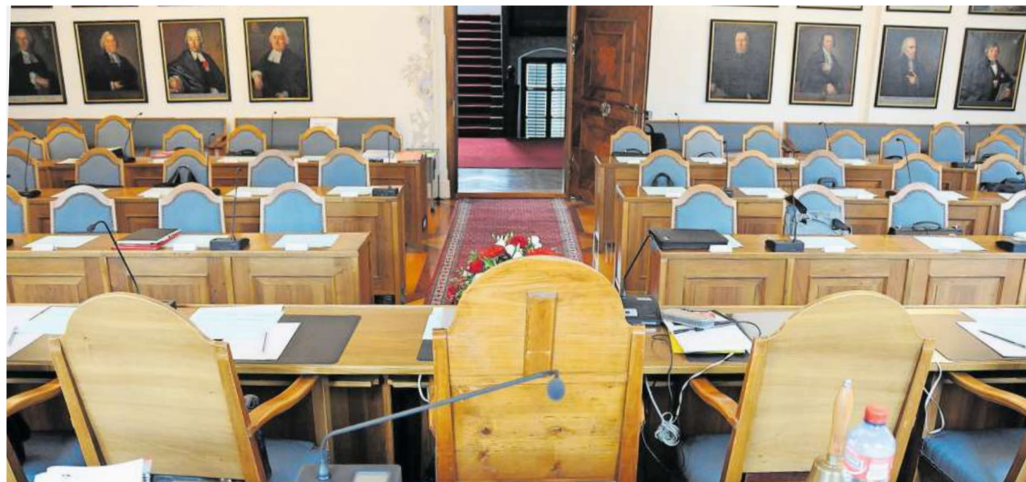
Blick in den Obwaldner Kantonsratssaal.